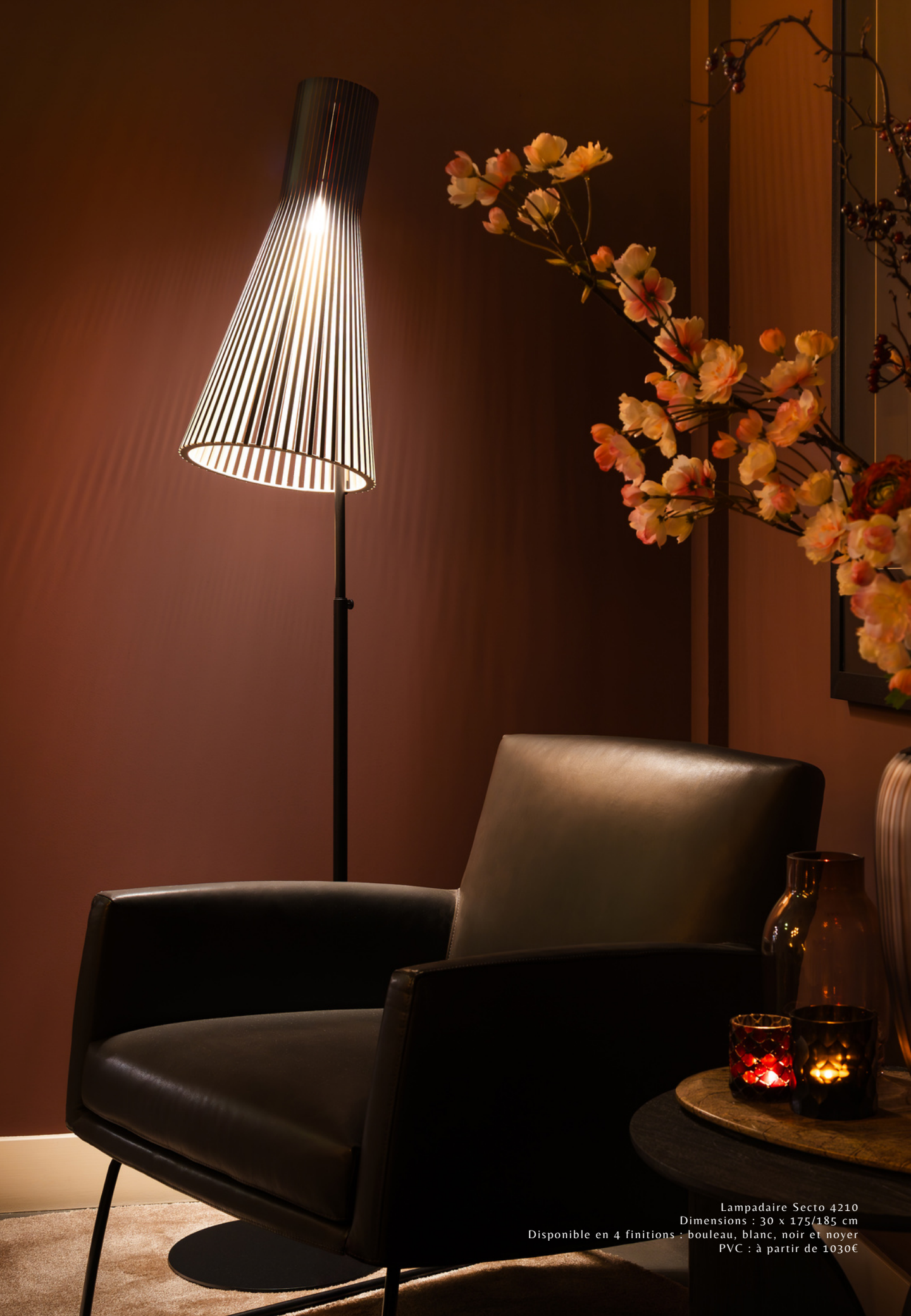
Lampadaire Secto 4210 Dimensions : 30 x 175/185 cm Disponibile en 4 finitions : bouleau, blanc, noir et noyer PVC : à partir de 1030€