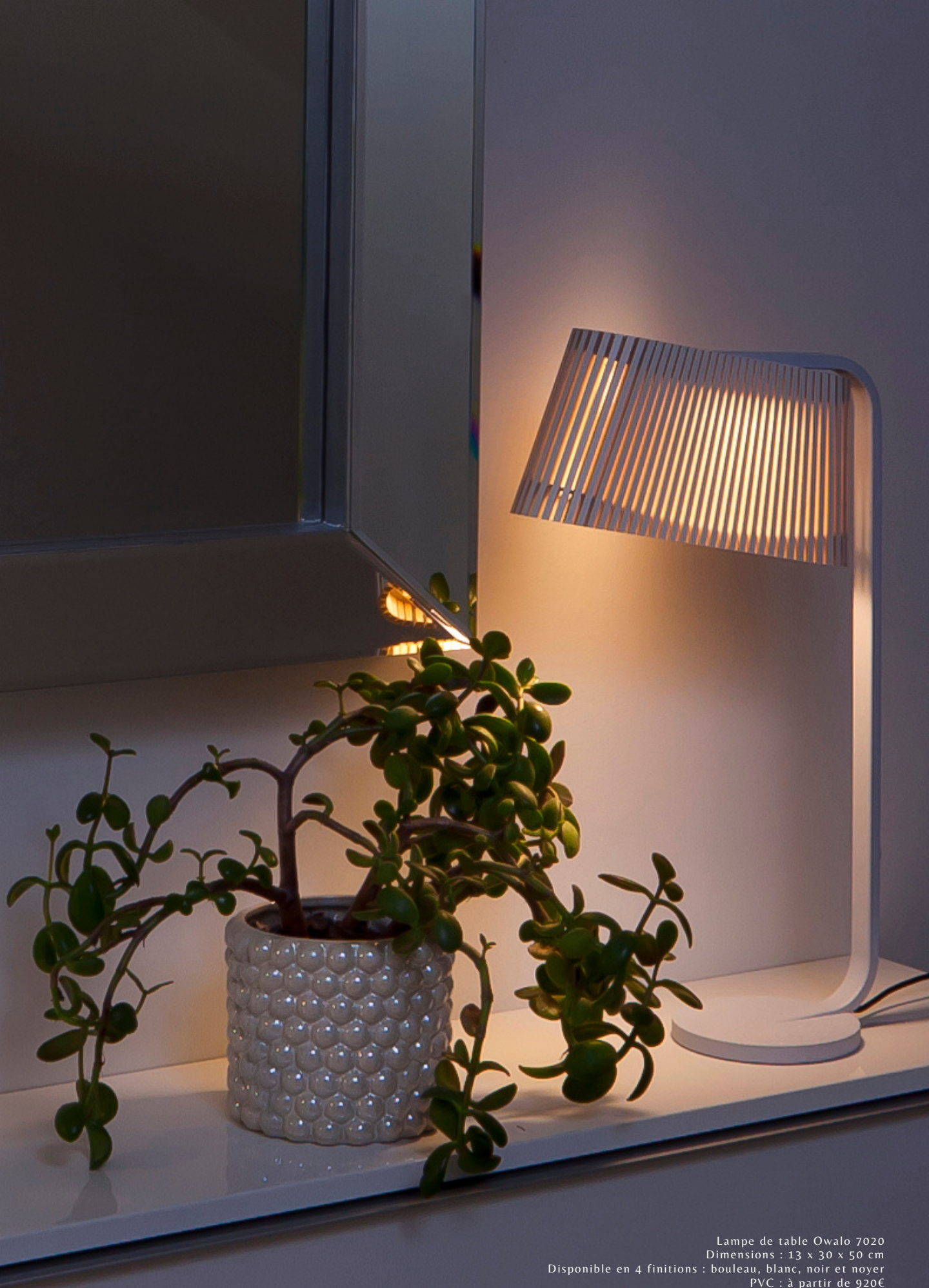
Lampe de table Owalo 7020 Dimensions : 13 x 30 x 50 cm Disponible en 4 finitions : bouleau, blanc, noir et noyer PVC : à partir de 920€