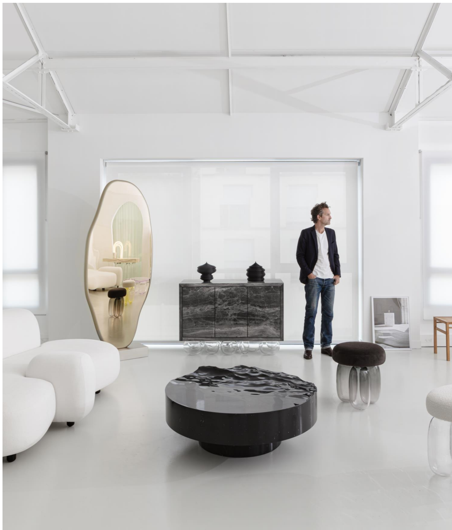
Espace d'exposition et siège de la marque MATHIEU LEHANNEUR