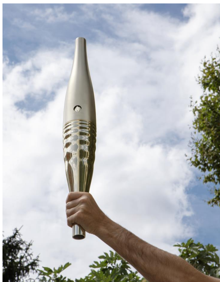
Torche Olympique Mathieu Lehanneur