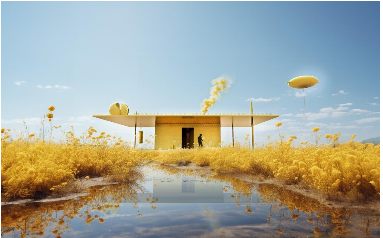
Projet Outonomy par Mathieu Lehanneur A découvrir sur Maison&Objet Janvier 2024