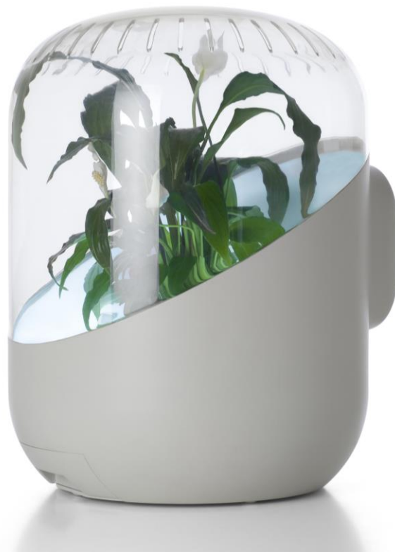
Purificateur d'air Andrea