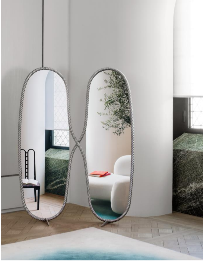
Miroirs sur pied Siamese ©Felipe Ribon Mathieu Lehanneur