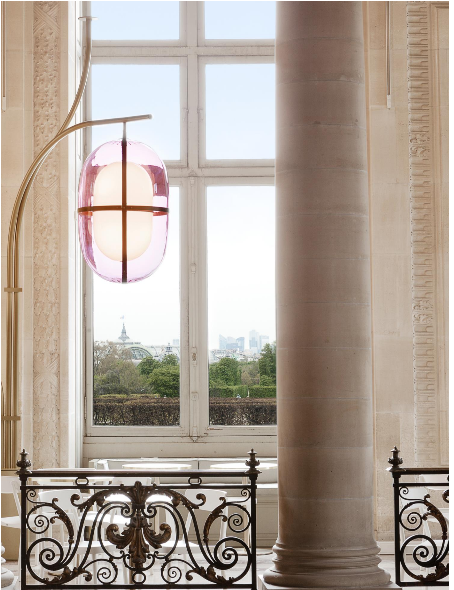
Café Mollien, Musée du Louvre, Paris ©Felipe Ribon Mathieu Lehanneur