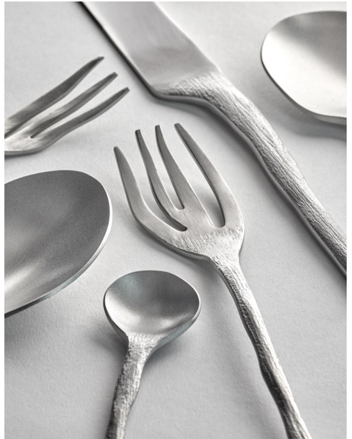
Collection de couverts Flora Vulgaris, par Roos Van de Velde pour Serax