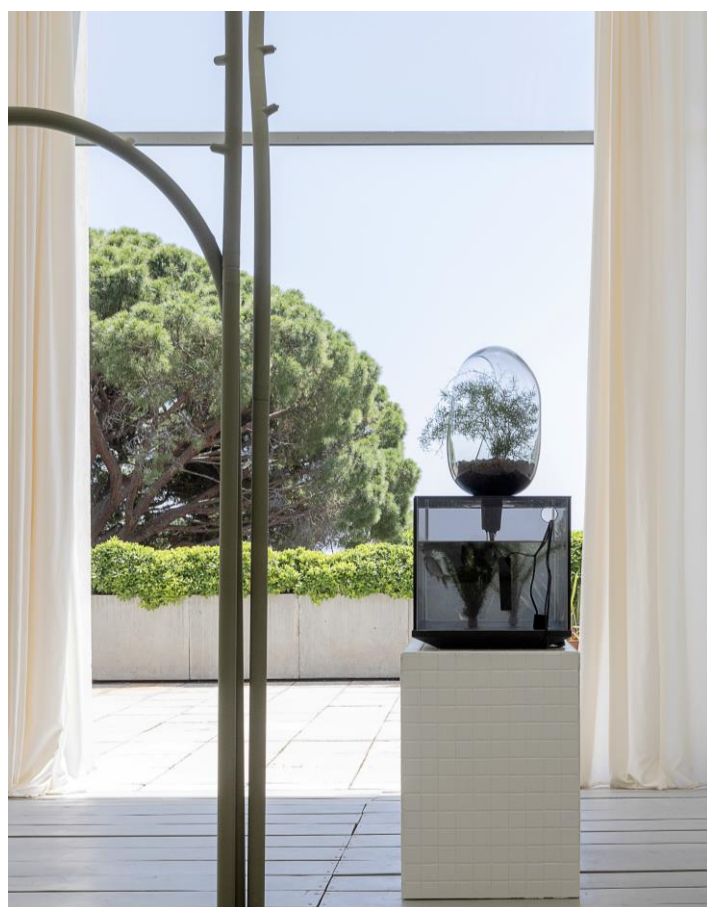
Fog trees, système de brumisation, et Local River, écosystème domestique, par Mathieu Lehanneur ©Felipe Ribon