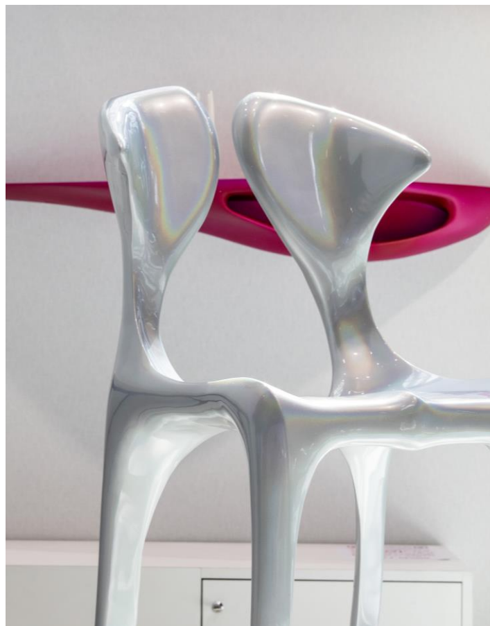
Chaise Dune Holo, par CyrylZ

Dans la continuité d'« ENJOY! », TECH EDEN affiche un optimisme onirique dans les formes et les couleurs, cette fois tourné vers une biophilie futuriste, un nouvel écrin de bien-être.