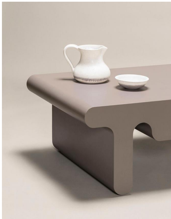
Table basse Ossicle en cuir, par GIOBAGNARA

Au cœur de l'« Hospitality Lab », Peclers Paris proposera, dans son Forum de tendances, trois capsules d'évasion biophiliques, immersives et prospectives : éveil, active et régénérative. Elles incarneront chacune l'une des facettes d'un secteur de l'hospitality en perpétuelle évolution et proposant de nouveaux codes d'expériences d'évasion bienfaitrices : le café s'hybride en espace bien-être, les spas luxueux s'invitent dans les chambres d'hôtel pour multiplier les expériences sensorielles et les lieux d'attente tels que les aéroports ou les gares sont mus en salles de sport grâce aux récentes technologies immersives.