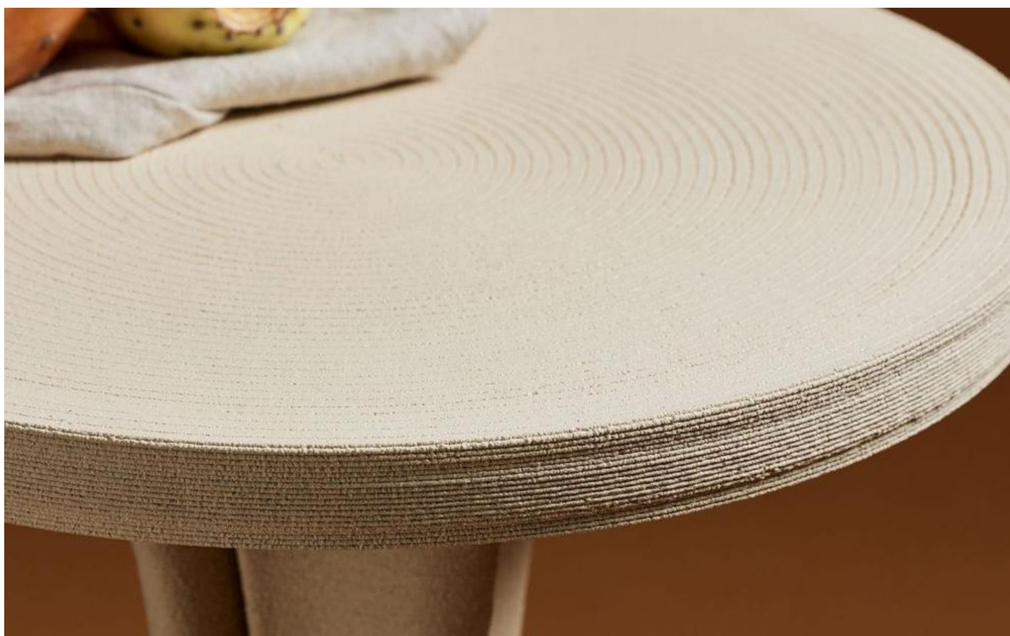
MONOLIGHT, table d'appoint imprimée en céramique 3D, par KERAMIK