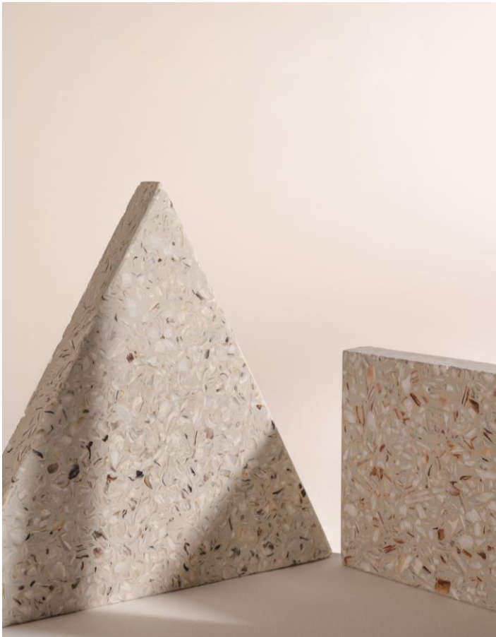
Matériau Ostrea constitué à 65% de coquillages recyclés, par Ostrea