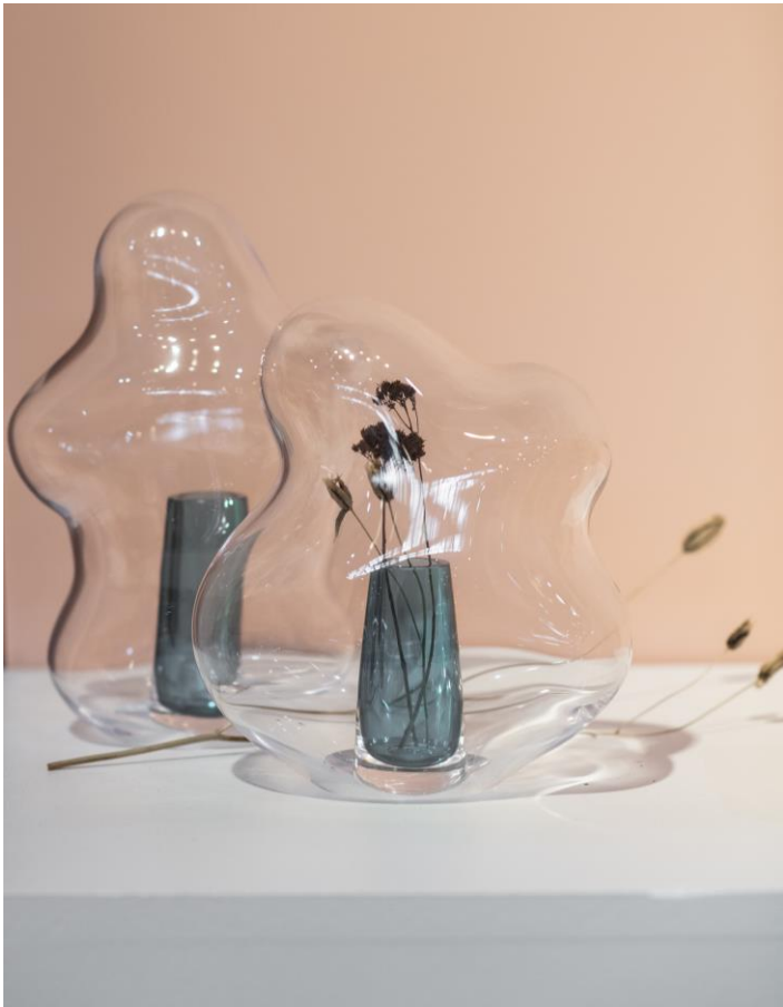
Bubble 03, par Tawain Crafts & Design