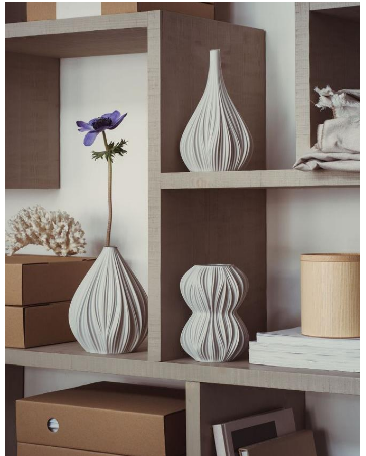
Vases Fald 169g, 104g et 99g imprimés en 3D, par Sheyn