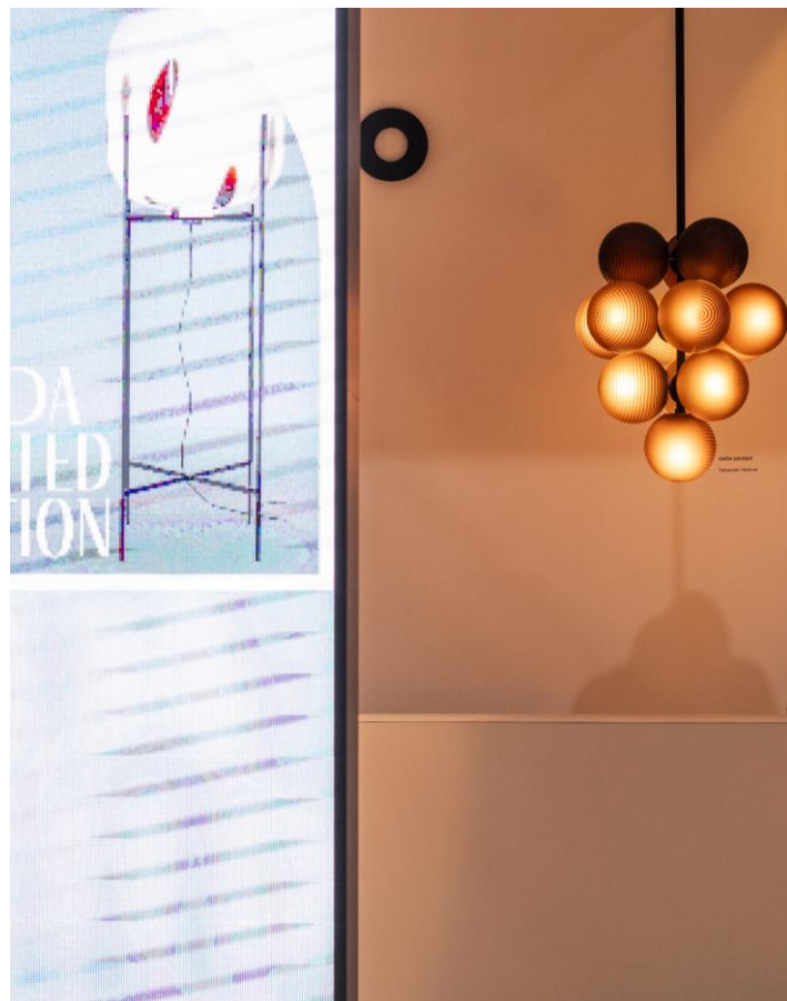
Suspension Stellar Grape, par Pulpo