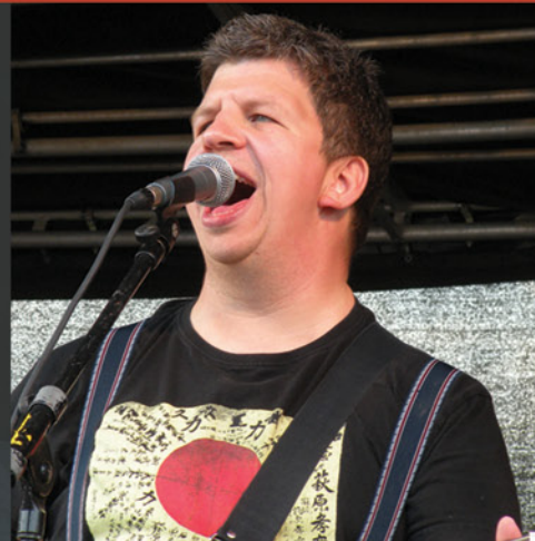
Musik til Kaffen