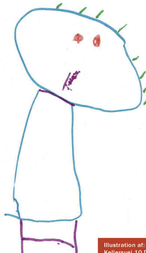
Illustration af: Ove Poulsen Kellersvej 10 D 2. plads i plakatkonkurrencen