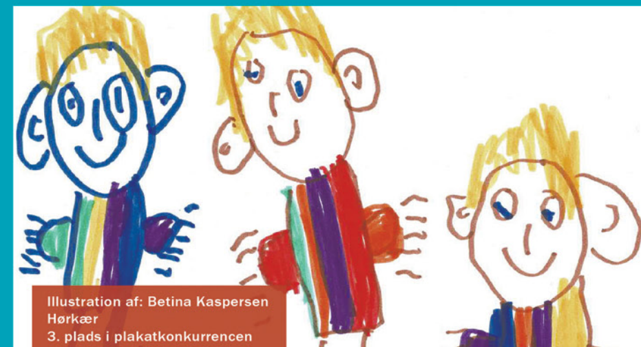
Illustration af: Betina Kaspersen Hørkær 3. plads i plakatkonkurrencen

Festival for mennesker med udviklingshæmning