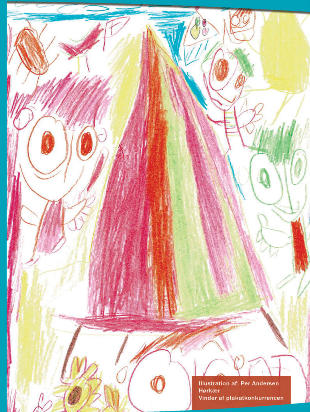
Illustration af: Per Andersen Hørkær Vinder af plakatkonkurrencen