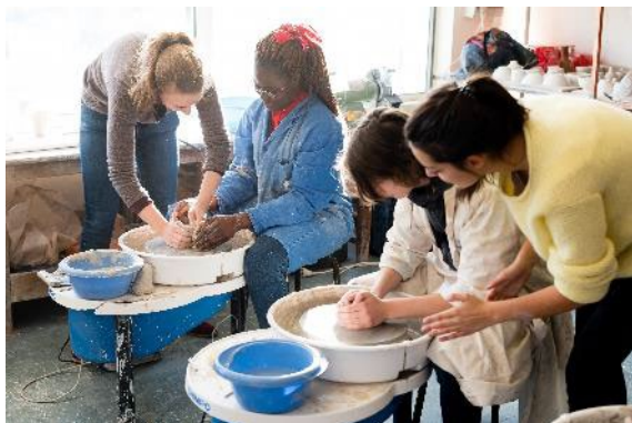
3. Découverte du Lycée Jean-Pierre Vernant et atelier pratique