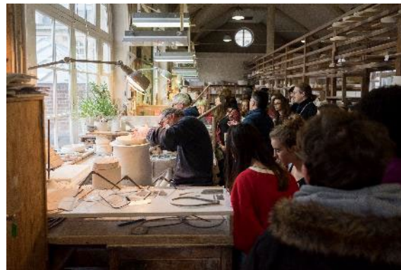
2. Démonstration par les artisans de la manufacture