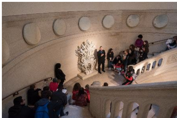
1. Visite de Sèvres, Manufacture et Musée nationaux